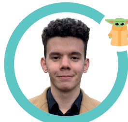
Ianis Baby Yoda