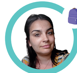
Julie Dora l'Exploratrice