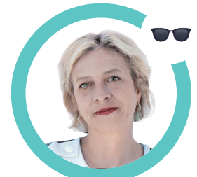
Bénédicte Miranda Priestly